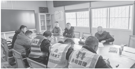
恩施：一封信传遍工地，安全宣传全覆盖

恩施州印发《致全体建筑工友节后安全生产的一封信》，督促落实复工“六个一”“五个到位”措施，确保宣传全覆盖、要求全落地。组织各县市及建设、施工、监理企业开展房屋市政工程复工第一课培训，夯实复工安全基础。